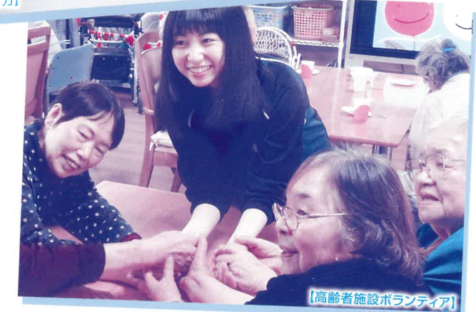
【高齢者施設ボランティア】