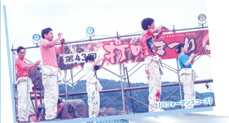
【パフォーマンスコース】