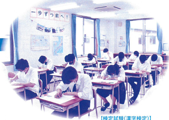
【検定試験(漢字検定)】